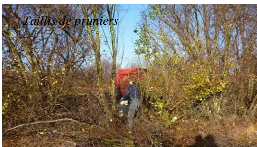
Taillis de pruniers