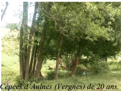
Cépées d'Aulnes (Vergnes) de 20 ans.