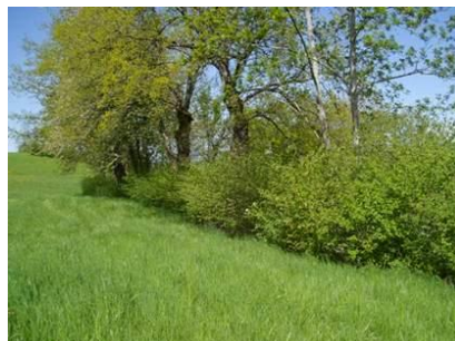
repousses de noisetiers de 2 ans