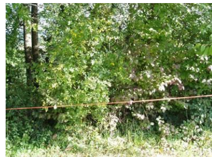
clôture du pied de haie

→ Elagage : il consiste à couper les branches au ras du tronc. Ne pas laisser de chicots qui empêchent une belle repousse et facilitent la pourriture du tronc.