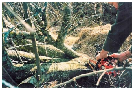
Recépage de pruniers

Les bovins « adorent » les jeunes pousses des haies (présence d'oligo-éléments différents de ceux présents dans l'herbe pâturée). Sans clôture, les haies ne se reconstitueront jamais. Leur vitalité ne tient donc qu'à un fil !!