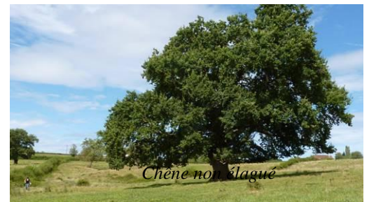
Chêne noir élagué