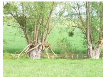
Têtard de Saule blanc : très productif