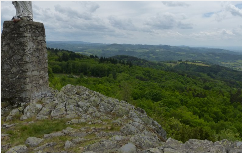
Vue depuis le pic de la garde (MDT)